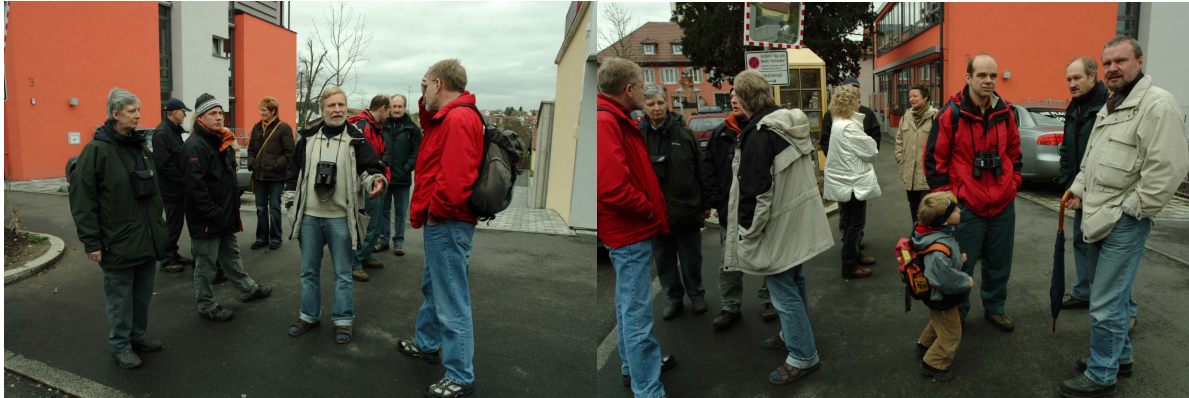
Angeregte Unterhaltung am Ausgangspunkt Viehmarktplatz