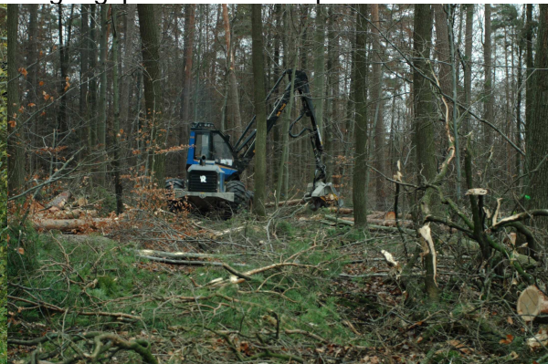
Der Holzvollernter im Einsatz