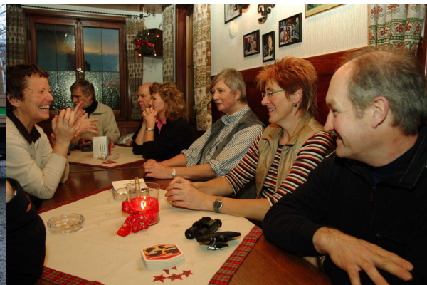
Angeregte Unterhaltung in der Gaststube