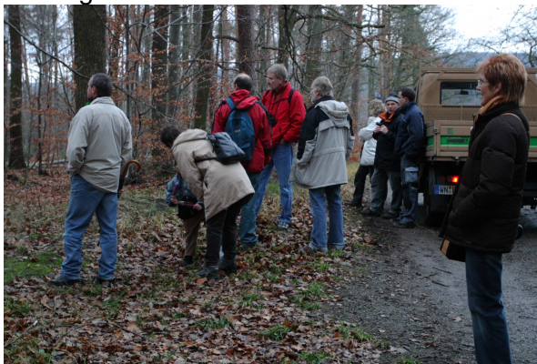
Zuschauer bei der Holzernte