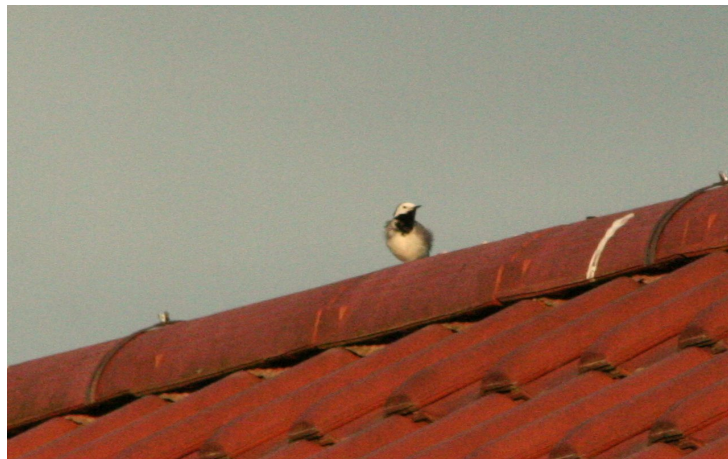
Bachstelze auf dem Angus-Stüble

Wolfgang hat diesen Weg prima ausgesucht. Er bietet viele alte (beschilderte) Bäume und Streuobstwiesen, die heute erst zum geringen Teil gemäht waren. Auch hatten wir freie Sicht über das Buchenbachtal, und durch den angrenzenden Wald im Westen ging es über den weiteren Weg zurück.