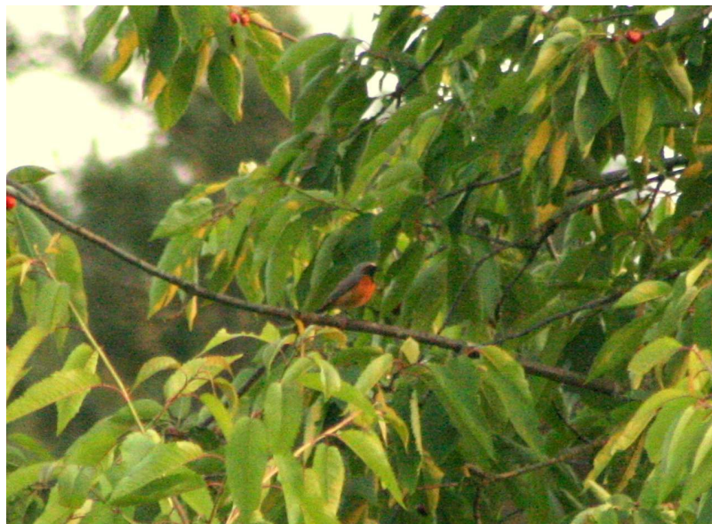
Gartenrotschwanz in den Kirschen

Den Gartenrotschwanz konnte man auf 2 Warten bestens beim Singen beobachten.